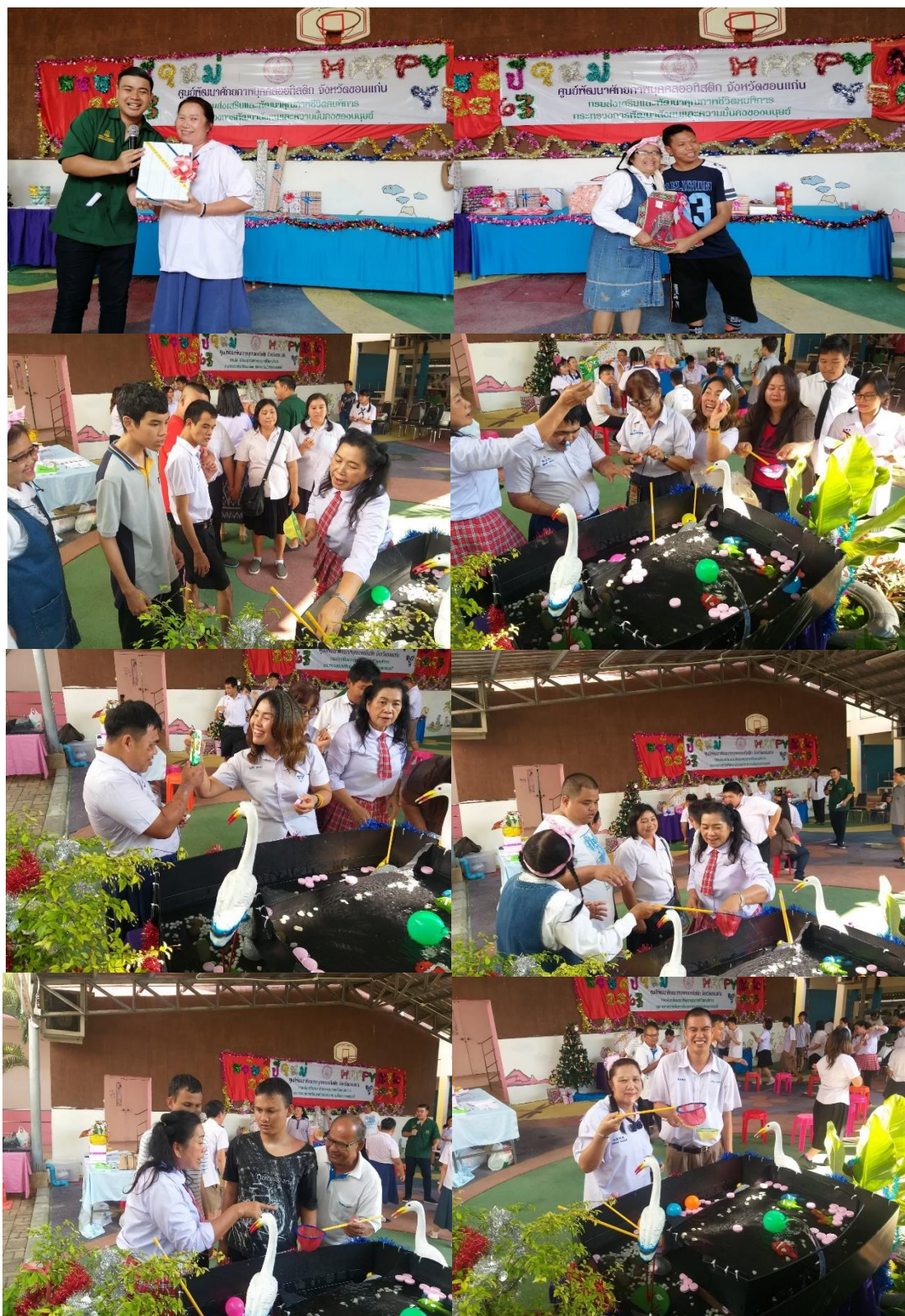
โครงการเรียนรู้วันสำคัญและประเพณีไทย ประจำปีงบประมาณ ๒๕๖๓ กิจกรรมส่งสุขปีใหม่ วันที่ ๒๖ ธันวาคม ๒๕๖๒ ณ ศูนย์พัฒนาศักยภาพบุคคลออทิสติก จังหวัดขอนแก่น