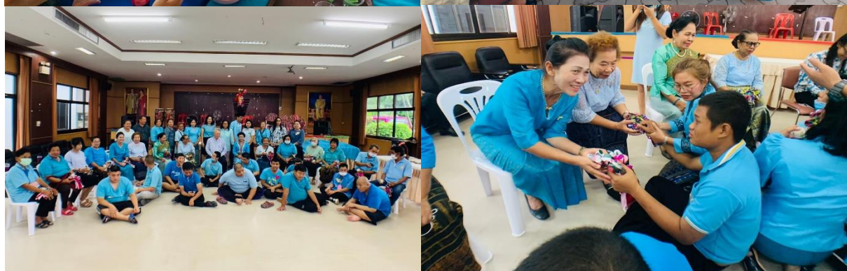
โครงการเรียนรู้วันสำคัญและประเพณีไทย ประจำปีงบประมาณ ๒๕๖๓ กิจกรรมรักแม่ให้โลกรู้ วันที่ ๑๑ สิงหาคม ๒๕๖๓ ณ ศูนย์พัฒนาศักยภาพบุคคลออทิสติก จังหวัดขอนแก่น