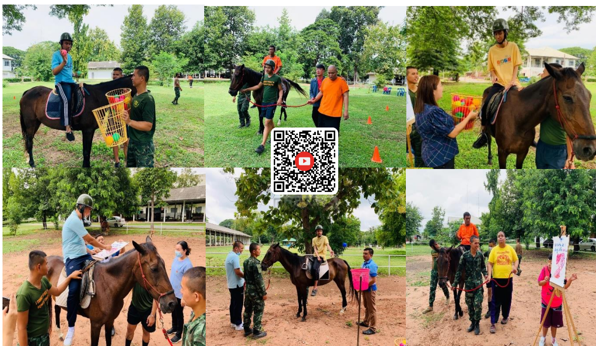
โครงการอาชาบำบัดประจำปีงบประมาณ 2563 ณ กองพันทหารม้าที่ ๖ ในสมเด็จพระศรีพัชรินทร์ อ.เมือง จ.ขอนแก่น ตั้งแต่ เดือน ธันวาคม ๒๕๖๒ – สิงหาคม ๒๕๖๓