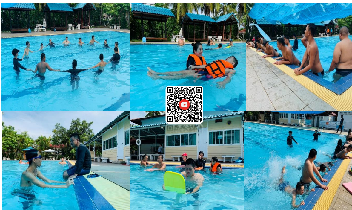
โครงการธารบำบัดเพื่อผ่อนคลาย จิตใจสบาย ร่างกายแข็งแรง ประจำปีงบประมาณ ๒๕๖๓ ตั้งแต่ เดือน กุมภาพันธ์ – พฤษภาคม ๒๕๖๓ ณ สระว่ายน้ำ หมู่บ้านสายฝน จังหวัดขอนแก่น